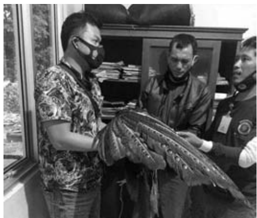
IG/BB BURUNG: Pihak Polsek Kaur Utara saat menyerahkan burung dilindungi kepada pihak BKSDA kemarin.

Lebih lanjut Irpanadi mengatakan setelah pleno di 15 PPK, setelah itu paling lambat tanggal 17 Desember 2020 yang akan datang KPU Kaur sudah harus menggelar rapat pleno tingkat Kabupaten Kaur. Kegiatan ini untuk memastikan jumlah suara hasil pilkada 2020 baik itu pilpub dan pilgub. Sementara ini KPU Kaur terus menginput hitung hasil pilkada secara online atau melalui hasil sirekap. Dari data yang masuk sirekap sampai dengan kemarin sudah lebih dari 50 persen, namun tetap saja yang menjadi patokan nantinya adalah hasil pleno secara manual. (cik)