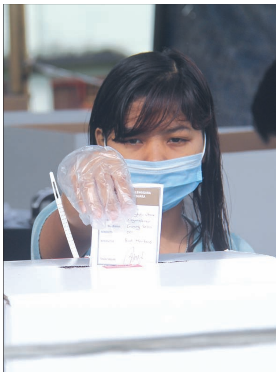
PROKES: Warga Gunung Selan, Kecamatan Arga Makmur, Bengkulu Utara saat menyalurkan hak pilihnya di TPS Rabu (9/12) lalu, dengan tetap mematuhi protokol kesehatan pencegahan Covid-19 yakni memakai masker.

untuk PSU sejauh ini baru 43 TPS yang berpotensi direkomendasikan Bawaslu. Untuk tindak lanjutnya, KPU daerah masih menunggu laporan resminya. Setelah rekomendasi masuk, Ilham sudah meminta KPU daerah melakukan kajian, apakah ada unsur pelanggaran yang diatur dalam undang-undang atau tidak. Sebagaimana ketentuan, ada waktu tiga hari untuk menindaklanjuti rekomendasi Bawaslu. "Kalau memang fatal, kalau itu terjadi pelanggaran di TPS, itu akan kita lakukan PSU," ujarnya di kantor KPU RI, Jakarta. Sementara itu, untuk PSS, Ilham menyebut pelaksanaannya dilakukan KPU daerah. Sejahter ini pihaknya belum mendapat laporan. Namun, kata dia, untuk PSS akibat kendala penyaluran logistik, semestinya prosesnya bisa disesuaikan. Jika logistik sudah tiba, PSS langsung dapat digelar. (far/c9/bay)