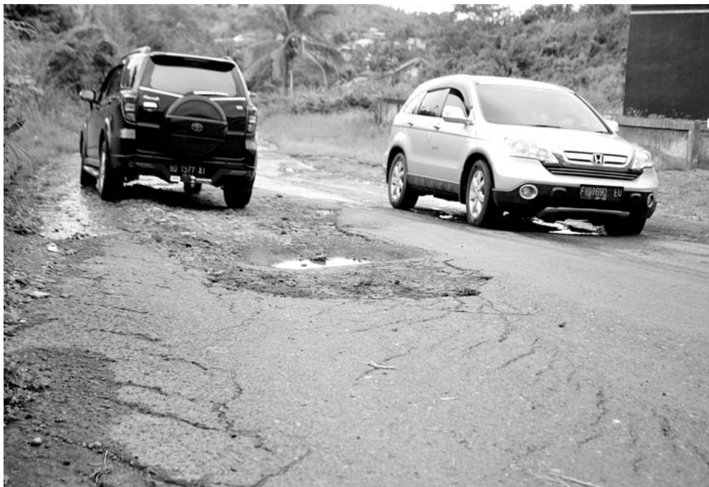
RAWAN LAKALANTAS: Jalan Desa Muara Langkap Kecamatan Bermani Ilir, yang rusak dan berlubang, menjadi keluhan warga dan pengendara yang melintas.