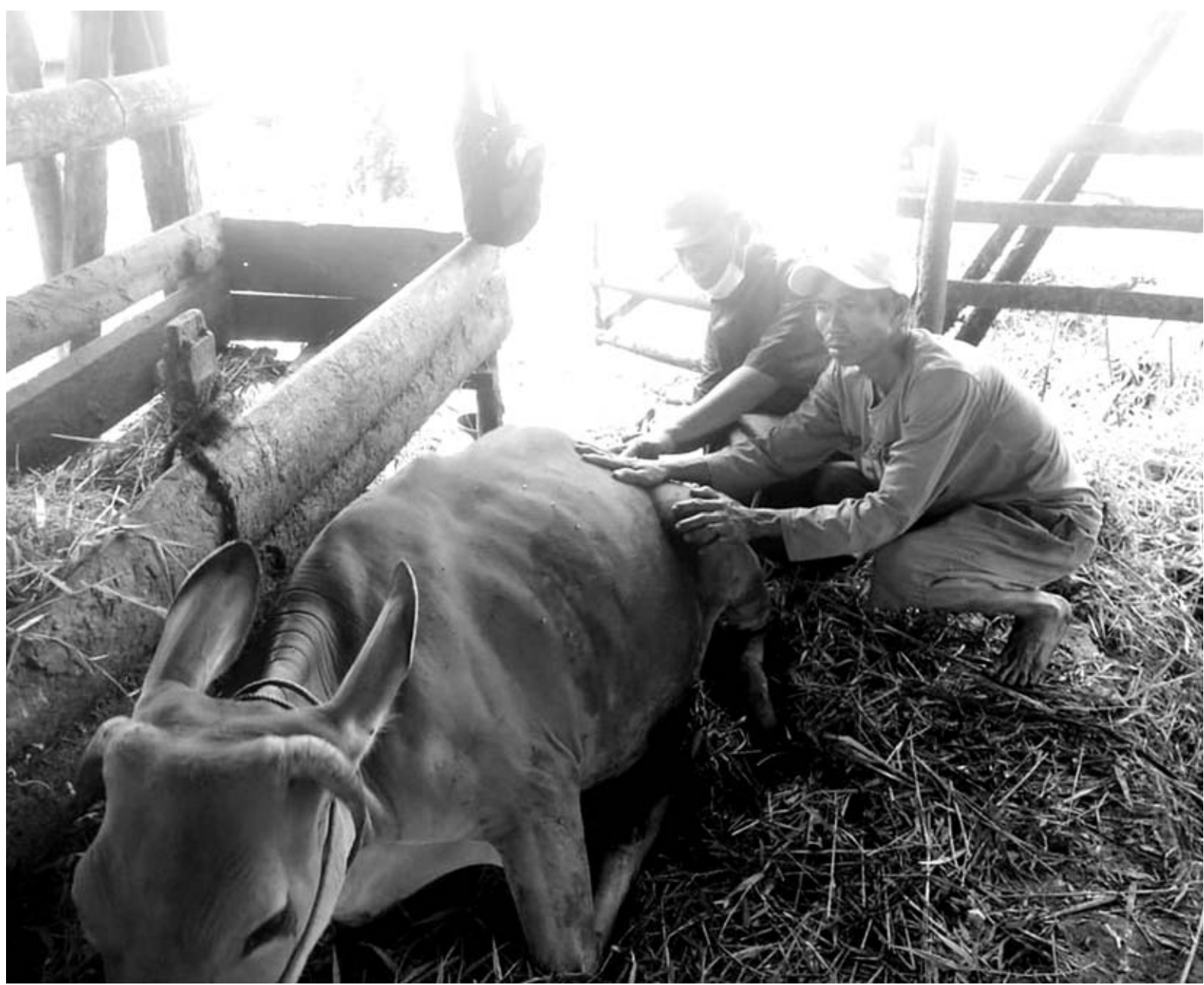
SUNTIK: Tim Distan Seluma dan dokter hewan saat menyuntikkan vaksin atau obat-obatan terhadap hewan ternak yang terserang penyakit.

Diketahui, beberapa kasus yang tengah diusut Kejari Seluma yaitu dua kasus yang telah naik ke Penyidikan (Dik) berupa kasus pembangunan Gedung Kantor Bank Bengkulu Cabang Tais tahun 2015 dan DD Desa Padang Genting tahun 2017. Sedangkan ada dua kasus yang masih dalam Penyelidikan (Lid) yakni pada kasus tunjangan perumahan dan transportasi DPRD Tahun 2018 serta pada perhaban gedung Disdik tahun 2019 lalu.(cup)