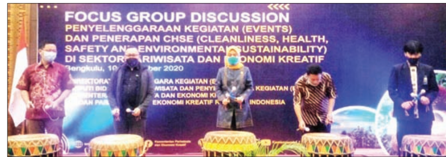
BUKA: Pembukaan Focus Group Discussion (FGD) penyelenggaraan kegiatan (events) dan penerapan CHSE di sektor pariwisata dan ekonomi kreatif.