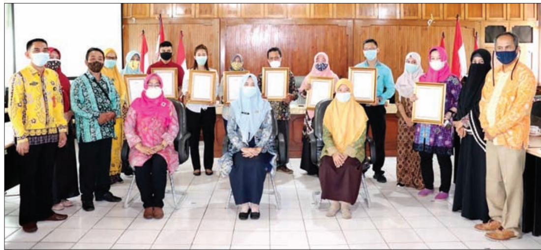
PENGHARGAAN: Tim Pemenang TPP Prokes usai menerima penghargaan di aula Dinkes Provinsi Bengkulu.

Ia juga mengatakan, peserta yang mendapatkan piagam/sertifikat ini mengikuti tahap demi tahap