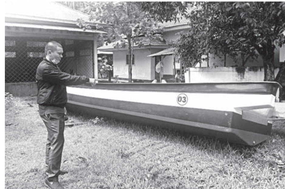
BANTUAN: Tiga unit perahu tangkap milik Dinas Perikanan BS yang akan disalurkan ke kelompok nelayan Pasar Bawah dan Pino Raya.

"Bagi masyarakat yang rusak KTP atau hilang dan sebagainya, silahkan datang ke Disdukcapil, kita punya stok 10 ribu blanko," ajak Gunawan. (tek)