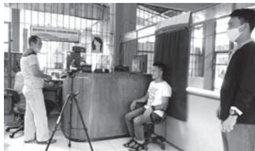
REKAM: Proses perekaman e-KTP masyarakat Bengkulu Selatan oleh Disdukcapil saat jemput bola ke warga kecamatan.

"Dalam jadwal sudah jelas, dan BS tidak ada kendala sehingga semua perekapan sesuai dengan penjadwalan kita," tutup Alpin. (tek)