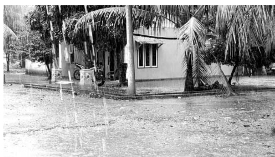
TINGGI: Curah hujan tinggi sedang mengguyur sejumlah wilayah di Kabupaten Seluma sejak beberapa hari terakhir.

Pihaknya juga telah memetakan daerah rawan bencana saat musim penghujan seperti ini. Diantaranya daerah rawan longsor dan daerah rawan banjir yang biasanya kerap terjadi seperti waktu sebelumnya. Dengan pemetaan ini, pihaknya bisa segera