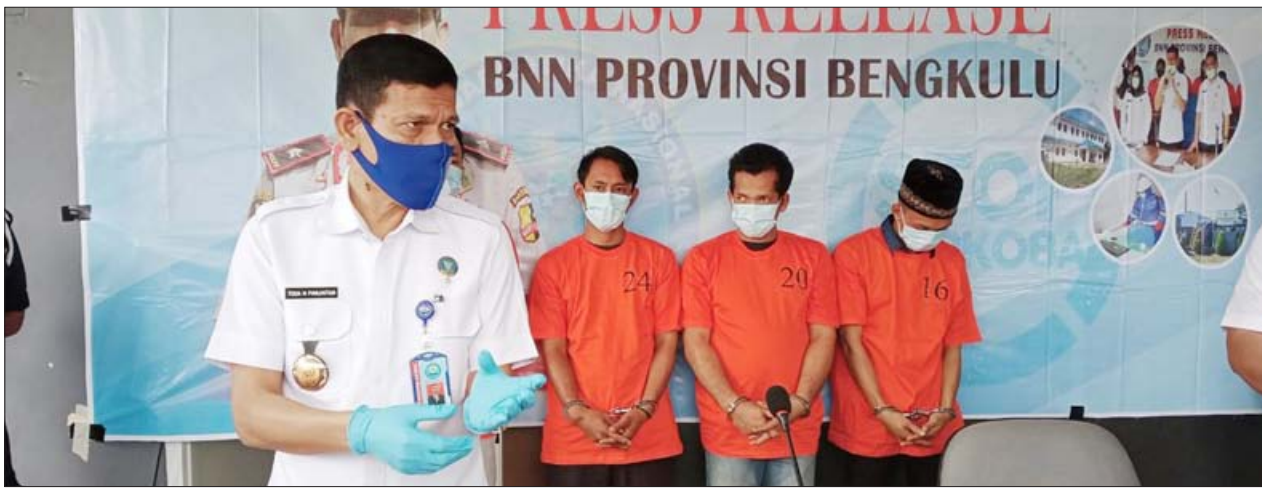
HASIL TANGKAPAN: Kepala BNNP Bengkulu Brigjen Pol Toga H Panjaitan memaparkan hasil tangkapan berupa 23 Kg Ganja dan empat tersangka pengedar.