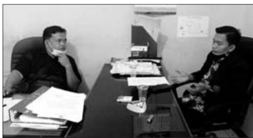
ALBERTUS/BB KOORDINASI: PPK Kelam Tengah saat berkoordinasi terkait pelaksanaan pleno yang akan dilaksanakan, hari ini (11/12).