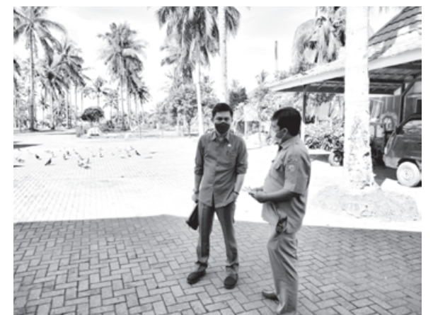
SIDAK : Saat Kepala BKD melakukan monitor ke salah satu Wajib Pajak Hiburan yang ada di Benteng.