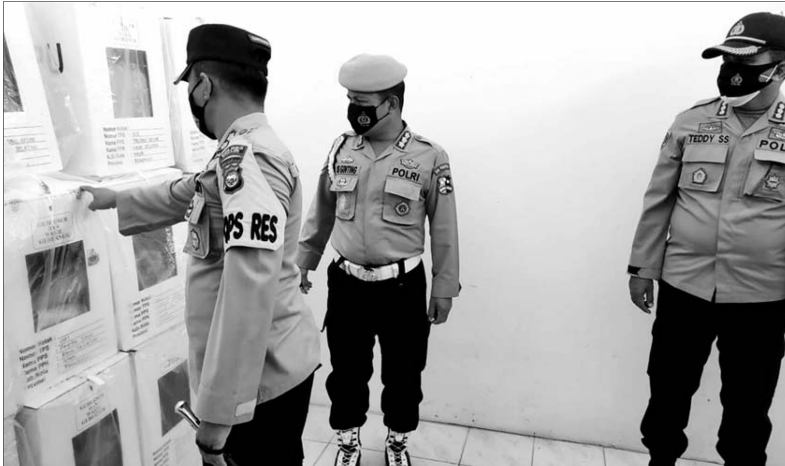
PANTAU: Tim dari Mabes Polri saat pantau pengaman pasca pencoblosan di Kaur kemarin.