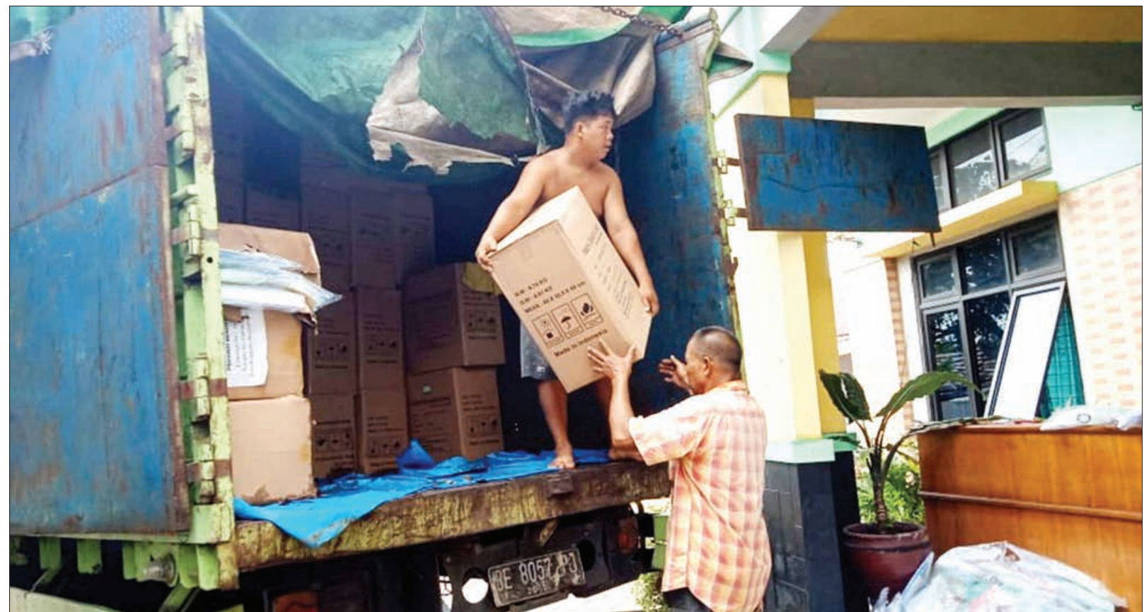
TIBA: Paket APD untuk tenaga medis yang menangani imunisasi vaksin covid di turunkan dari mobil.

Dengan keseriusan pemerintah tersebut, pihaknya juga mengimbau seluruh masyarakat untuk dapat mengikuti protokol kesehatan yang telah ditetapkan pemerintah pusat sebagai upaya bersama dalam memutus mata rantai penyebaran Covid-19," ungkapnya. (hkm)