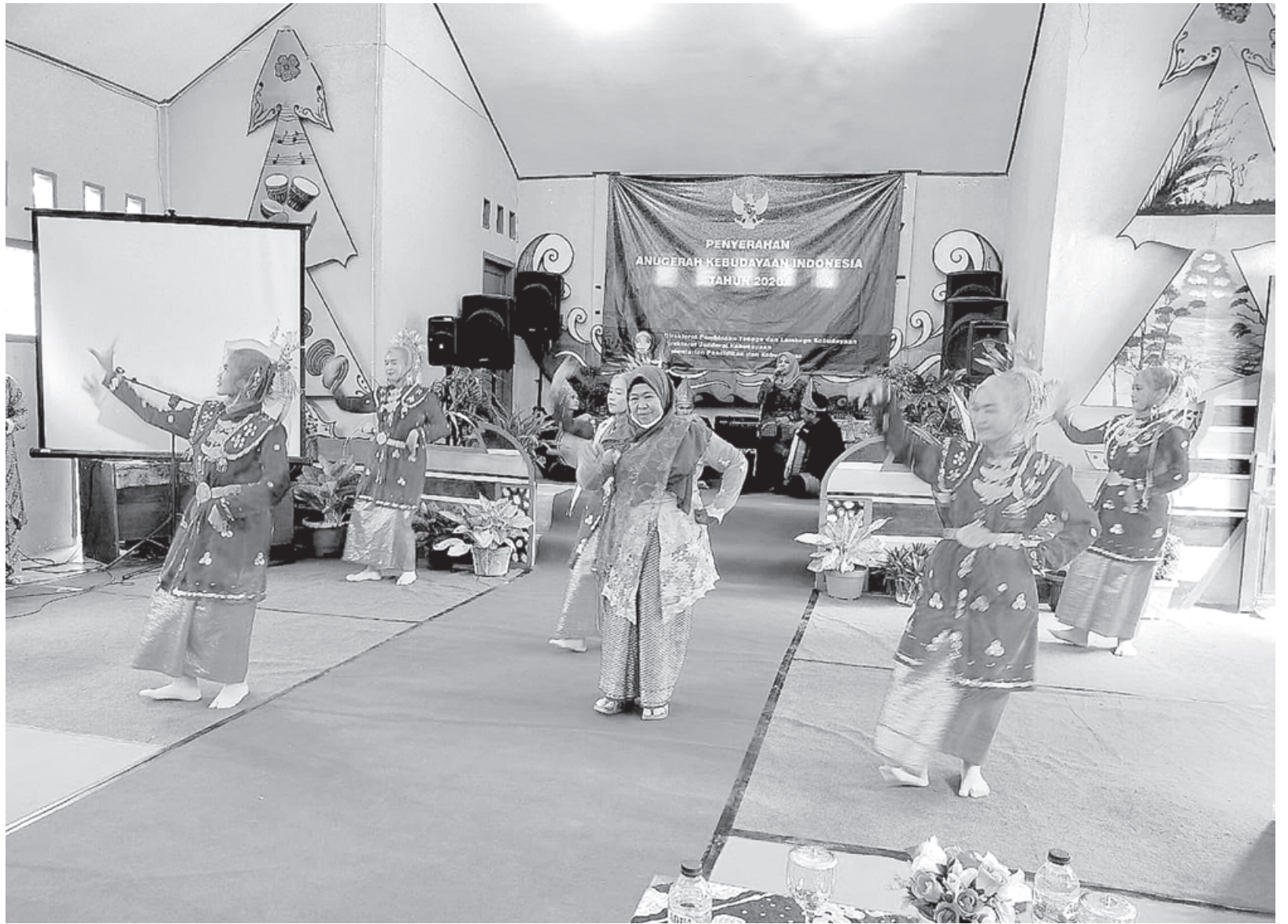
BUDAYA: Penampilan tari gandai dengan penari menggunakan baju adat khas Mukomuko saat kegiatan di Aula Disdikbud Mukomuko.

"Sudah kita ajukan untuk penerimaan baru tahun 2021. Apakah akan dikabulkan, dan akan diberi kesempatan perekrutan tahun depan, kita belum tahu. Yang jelas, tugas kita mengajukan ke pusat," pungkasnya. (hue)