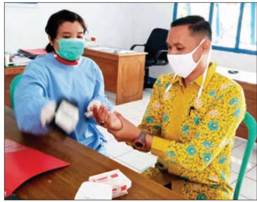
PETUGAS: Staf Kelurahan Anggut Bawah saat diperiksa kesehatan oleh petugas tim medis.