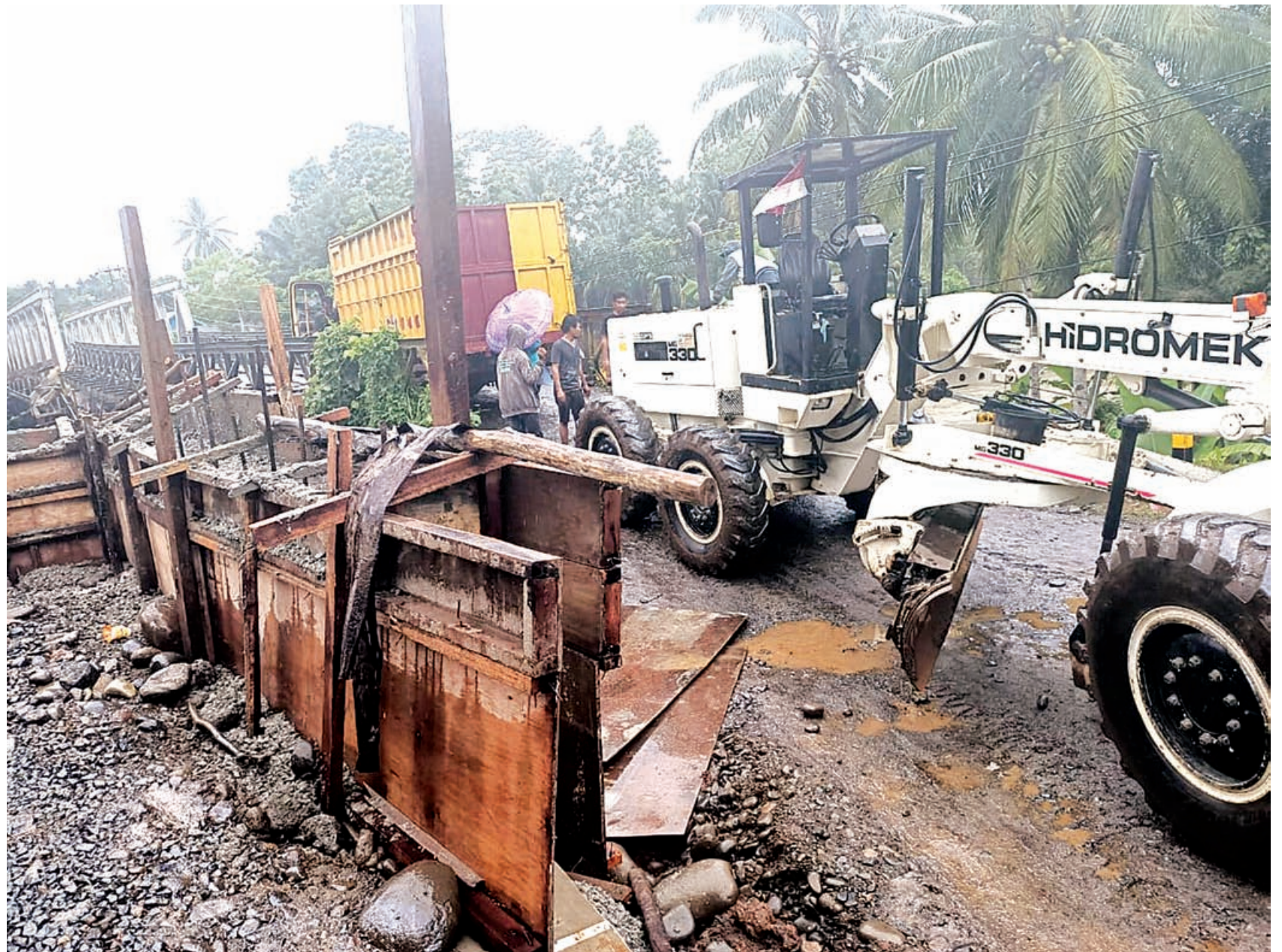
JEBOL: Lantai jembatan darurat di Desa Tanjung Agung, Kecamatan Tanjung Agung Palik jebol karena sudah lapuk dan terus dilintasi kendaraan.

"Jadi semua hal kita antisipasi sehingga tidak terjadi korban. Curah hujan belakangan ini intensitasnya cukup tinggi dan membuat beberapa daerah berpotensi terjadi banjir," jelasnya. (qia)