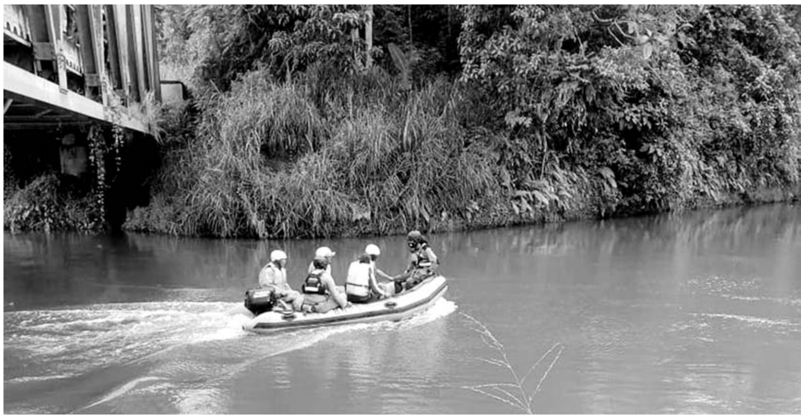
PENCARIAN: Tim SAR dari BPBD Kabupaten Kepahiang mengitari sungai menggunakan perahu karet dalam pencarian warga diduga tenggelam di Sungai Musi Desa Pulogeto.