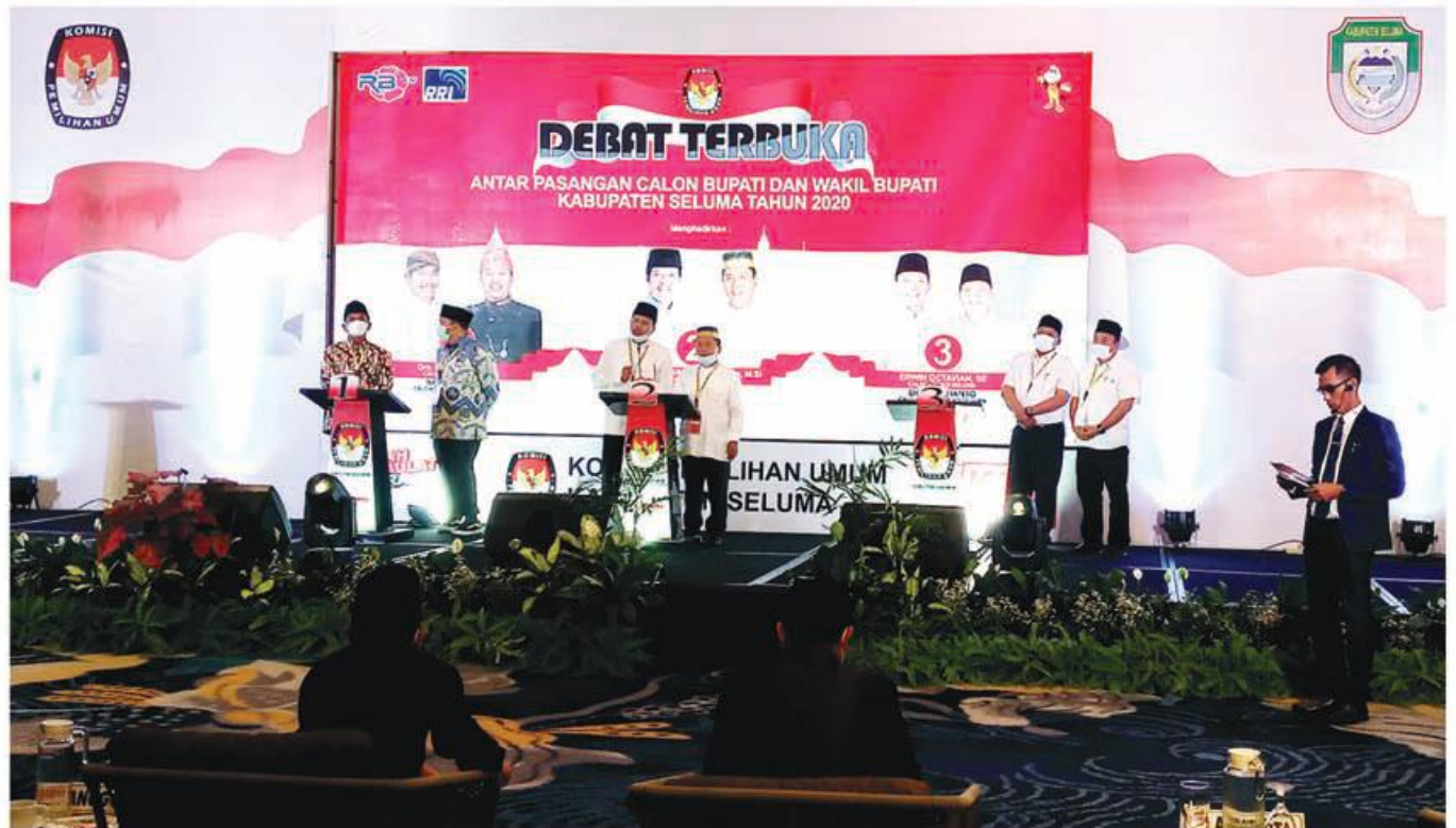
DEBAT: Tampak tiga pason Bupati dan Wakil Bupati Seluma mengikuti debat publik yang digelar oleh KPU Seluma di Hotel Mercure Kota Bengkulu.

SELUMA - Tiga pasangan calon (Pason) Bupati dan Wakil Bupati Seluma saling beradu gagasan dan ide dalam rencana mereka memajukan Kabupaten Seluma apabila terpilih nanti. Momen itu terjadi dalam kegiatan Debat Publik Pasangan Calon Bupati dan Wakil Bupati Seluma tahun 2020 yang digelar KPU Kabupaten Seluma di Hotel Mercure Kota Bengkulu pada Jumat (13/11) malam. Acara yang dimulai sejak pukul 20.00 WIB inipun tetap menerapkan protokol kesehatan secara ketat dari mulai pintu masuk hingga kedalam ruangan debat publik. Meskipun begitu, kegiatan ini tidak sampai kehilangan esensinya. Lantaran masyarakat tetap dapat menyaksikan perhelatan debat tersebut melalui RBTv. Kegiatan debat pertama yang diselenggarakan oleh KPU Seluma ini berlangsung dengan sukses sebagaimana diharapkan. (cup/prw)