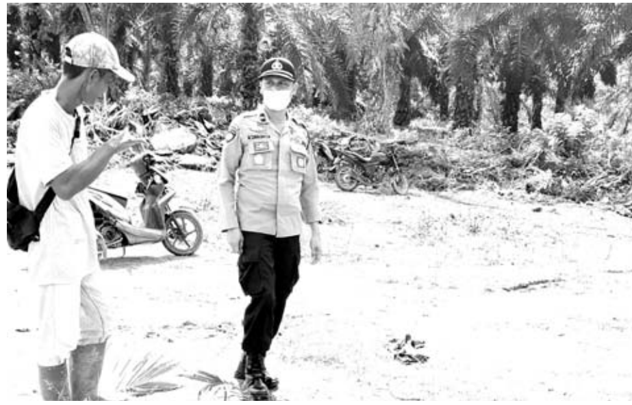
LAPOR: Usai mendapati laporan, personel Polsek Terawang Jaya turun ke lokasi kejadian.

Lanjutnya untuk capaian pajak hingga saat ini diantaranya seperti pajak hotel Rp 3,7 juta, pajak restoran Rp 400 juta, pajak reklame Rp 87 juta, pajak penerangan Rp 2,9 miliar, pajak mineral bukan logam dan batuan Rp 232 juta. “Kemudian pajak air bawah tanah Rp 50 juta, Pajak Bumi dan Bangunan (PBB) 1,9 miliar, Pajak Bea Perolehan Hak Atas Tanah dan bangunan (BPHTB) Rp 805 juta,” Tutup Dessy. (jee)