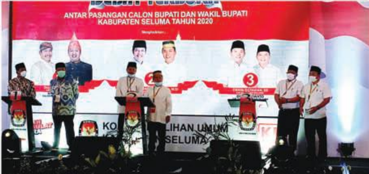
PAPARKAN: Ketiga pason Bupati dan Wakil Bupati Seluma memaparkan gagasan dan idenya dalam Debat Publik.