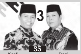
Kopli 35 Rozi