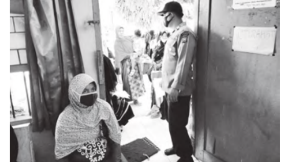
PANTAU: Anggota Polsek Nasal saat mengamankan pembagian BST di Kantor Pos Nasal, kemarin (14/11).