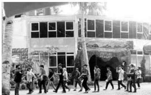
WISATA : Inilah salah satu tempat wisata yang ada di Bengkulu Tengah.