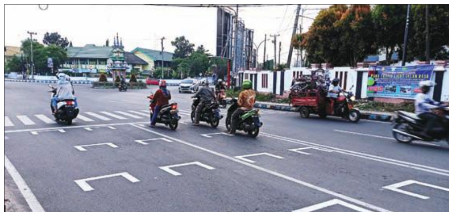
JAGA JARAK: Pengendara sepeda motor menjaga jarak saat berhenti lampu lintas.

Kepala Disnaker Kota Bengkulu, Munarwan mendukung penuh dan memberikan apresiasi terhadap LPK ini. "Kita juga akan terus berkoordinasi untuk bisa membantu program untuk pengangguran dan menjadi solusi terutama pada pengangguran yang terdampak Covid-19," tuturnya. (hkm)