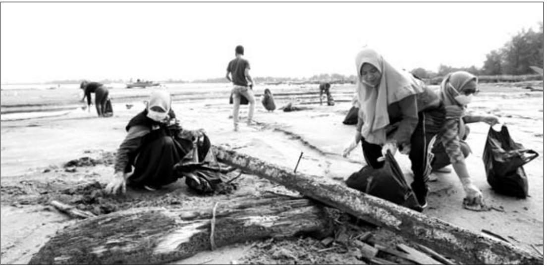
BERSIH PANTAI: Aksi bersih pantai terus rutin dilakukan. Kali ini dilakukan dalam gerakan aksi cinta pantai.

pedagang masih juga memasang tenda dan lainnya itu yang membuat taman tersebut menjadi semrawut. “Penertiban tetap akan kita lakukan karena jika tidak, bisa kumuh semrawut seperi pasar,” jelasnya. Dilanjutkannya, izin untuk pedagang yang berjualan di taman tersebut sebanyak 28 sesuai dengan auning yang ada, selebihnya pihaknya tidak pernah mengeluarkan izin. Sementara yang diberikan izin membayar sewa auning sebesar Rp 1 juta pertahun. “Makanya kita tidak mengeluarkan izin kecuali yang di auning saja, seperti tenda-tenda, tempat bermain di parkir itu tidak pernah ada izin,” terangnya.