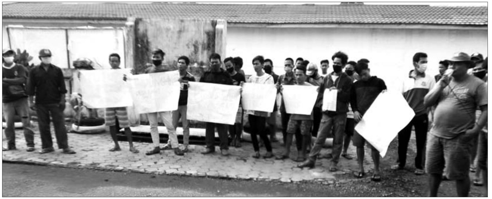
AKSI: Aliansi Masyarakat Desa Tanjung Sanai II Kecamatan PUT saat menyampaikan aspirasi mereka dengan berbagai poster.

Mengingat kegiatan pelatihannya tidak jadi dilaksanakan, Eldi pastikan tidak akan membagikan 300 pieces seragam itu ke tukang yang telah mendaftar. (sca)