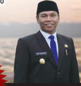
Plt. Gubernur Bengkulu Dedy Ermansyah, SE

JUARA 1 Rp 5.000.000 JUARA 2 Rp 3.000.000 JUARA 3 Rp 2.000.000