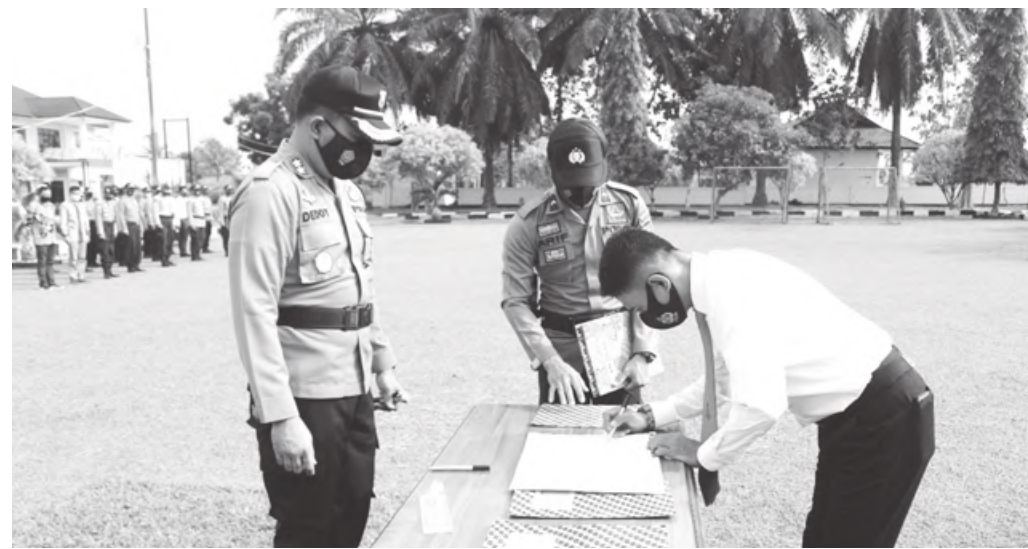
LAKUKAN: Penandatanganan pakta integritas jelang Pilkada oleh seluruh personel Polres BS Sabtu (14/11)

Untuk diketahui dalam satu bulan ini sudah dua bus Sriwijaya terbalik di wilayah perbatasan Bengkulu - Lampung. Sebelumnya bus Sriwijaya dengan nopol BD 7132 LE yang terbalik di Tebing Bayur Desa Air Long Kecamatan Maje Kabupaten Kaur, Jumat (6/11) sekitar pukul 05.00 WIB. Tidak ada korban jiwa dalam laka ini, bahkan 10 orang penumpang langsung dievakuasi naik travel. Bus Sriwijaya dari Lampung ke Bengkulu terbalik karena tidak bisa menahan tebing Bayur hingga akhirnya mundur dan terbalik. (cik)