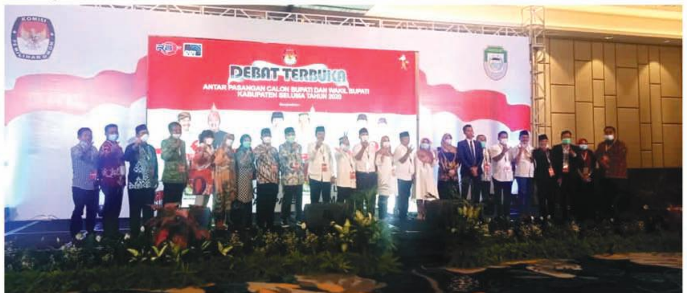
BERSAMA: Foto Bersama semua penyelenggara dan tamu undangan serta ketiga pason yang hadir dalam kegiatan Debat Publik.