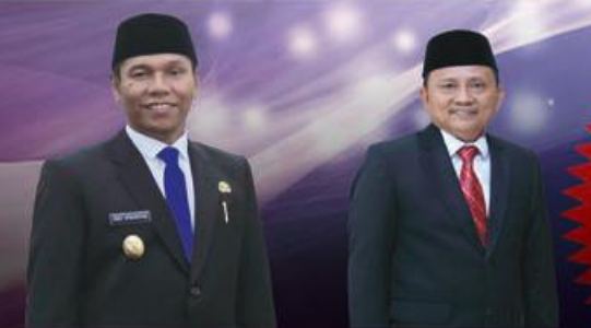
Plt. Gubernur Bengkulu Dedy Ermansyah, SE