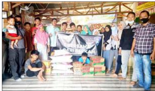
ABADIKAN: Tim Aromania Perfumery dan Harian RB saat jelang penyaluran sembako.