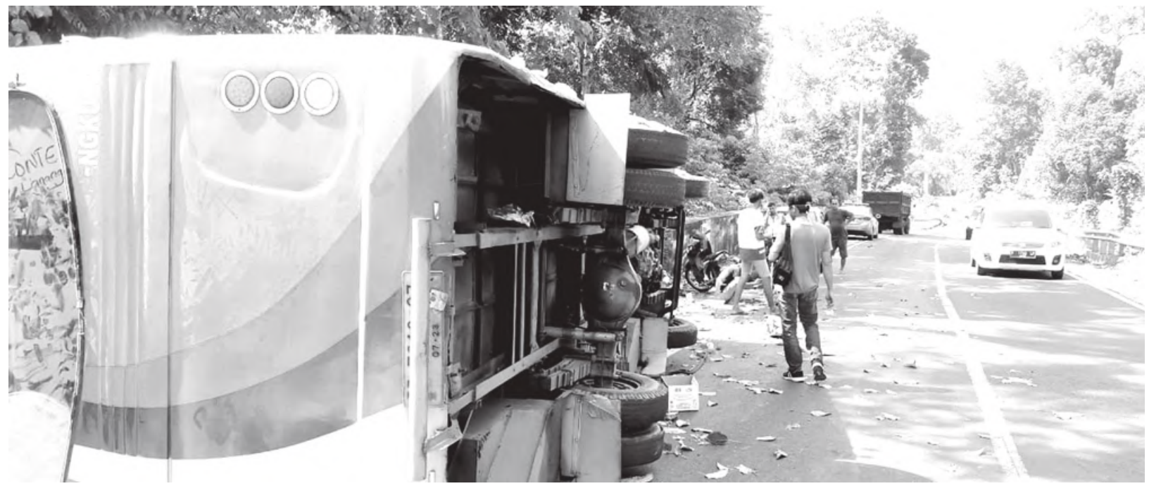
TERBALIK : Lagi bus Sriwijaya terbalik di wilayah perbatasan Bengkulu – Lampung menyebabkan satu penumpang meninggal dunia.

Karena itu, Siswanto mengajak seluruh tenaga kesehatan untuk terus berupaya menyelesaikan program pemberian obat cacang pada anak-anak. Karena ini sudah menjadi program rutin tahunan dan penting dilakukan. (tek)