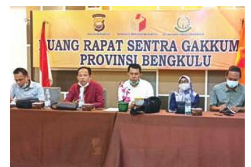
PENGUATAN: Bawaslu Provinsi Bengkulu menggelar koordinasi dengan Bawaslu Kabupaten/Kota se Provinsi Bengkulu.