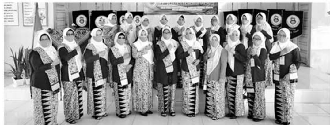
BERSAMA: Sesi foto bersama pengurus IBI Daerah Provinsi Bengkulu dengan Pengurus IBI Cabang Kabupaten Benteng.