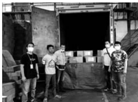
DISTRIBUSI: KPU dan Bawaslu serta anggota TNI dan Polri saat mengecek logistik surat suara di percetakan sebelum diberangkatkan menuju Kabupaten RL.

Rinciannya, sampai Restu, yaitu 200.577 Lembar Surat Suara Pilkada Bupati dan Wakil Bupati Kabupaten RL masing-masing