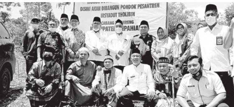
ARIE/RB SIAP DIBANGUN: Ponpes PCNU Kepahiang bersama sejumlah undangan foto bersama atas peletakan batu pertama pembangunan Ponpes Irsyadut Tholibin.

KEPAHIANG - Kerja sama dengan Pondok Pesantren (Ponpes) Tebu Ireng Jombang Jawa Timur, Pengurus Cabang Nahdatul Ulama (PCNU) Kabupaten Kepahiang mendirikan Ponpes baru di Desa Kandang, Kecamatan Seberang Musi. Ponpes ini diberi nama