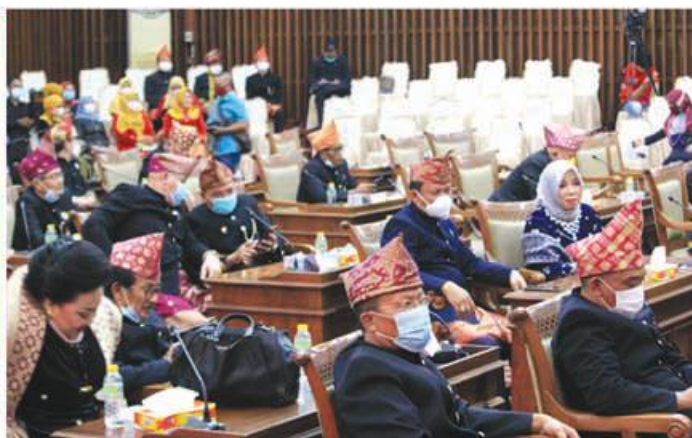
PROTOKOL KESEHATAN: Anggota DPRD Provinsi Bengkulu, unsur FKPD dan OPD di lingkungan Pemerintah Provinsi Bengkulu tetap menerapkan protokol kesehatan pada kegiatan ini, demi mencegah penyebaran Covid 19.