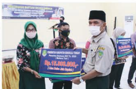
PENYERAHAN: Kepala BPBD saat menyerahkan bantuan secara simbolis kepada penerima.