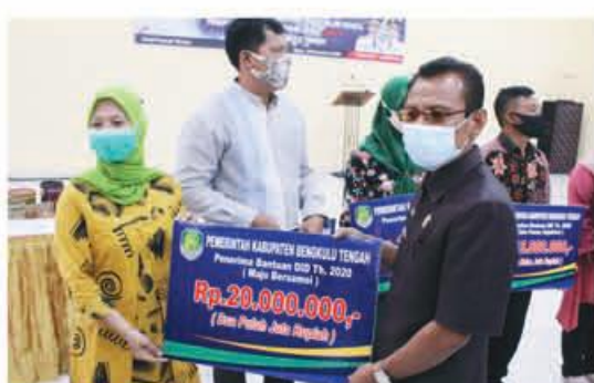
PENYERAHAN: Camat Pondok Kubang saat menyerahkan bantuan secara simbolis kepada penerima.