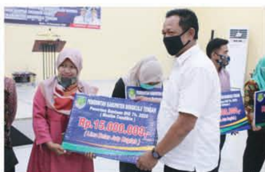
PENYERAHAN: Sekretaris Dinas Perikanan dan Ketahanan Pangan saat menyerahkan bantuan secara simbolis kepada penerima.