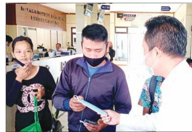
BAGI MASKER: Plt. Kadis Dukcapil Kota Bengkulu membagikan masker kepada warga yang datang ke Dinas Dukcapil.

Besarannya, terang Iskandar yaitu untuk program JPS se Provinsi Bengkulu ini total anggarannya Rp 120,400 miliar dan baru terealisasi Rp 86,086 miliar atau 71,50 persen. Lalu di kesehatan totalnya mencapai Rp 388,692 miliar dengan realisasi Rp 143,618 miliar atau 36,95 persen. Kemudian untuk pemulihan ekonomi baru terealisasi Rp 15,576 miliar dari total anggaran Rp 38,091 miliar atau baru 40,89 persen. (key)