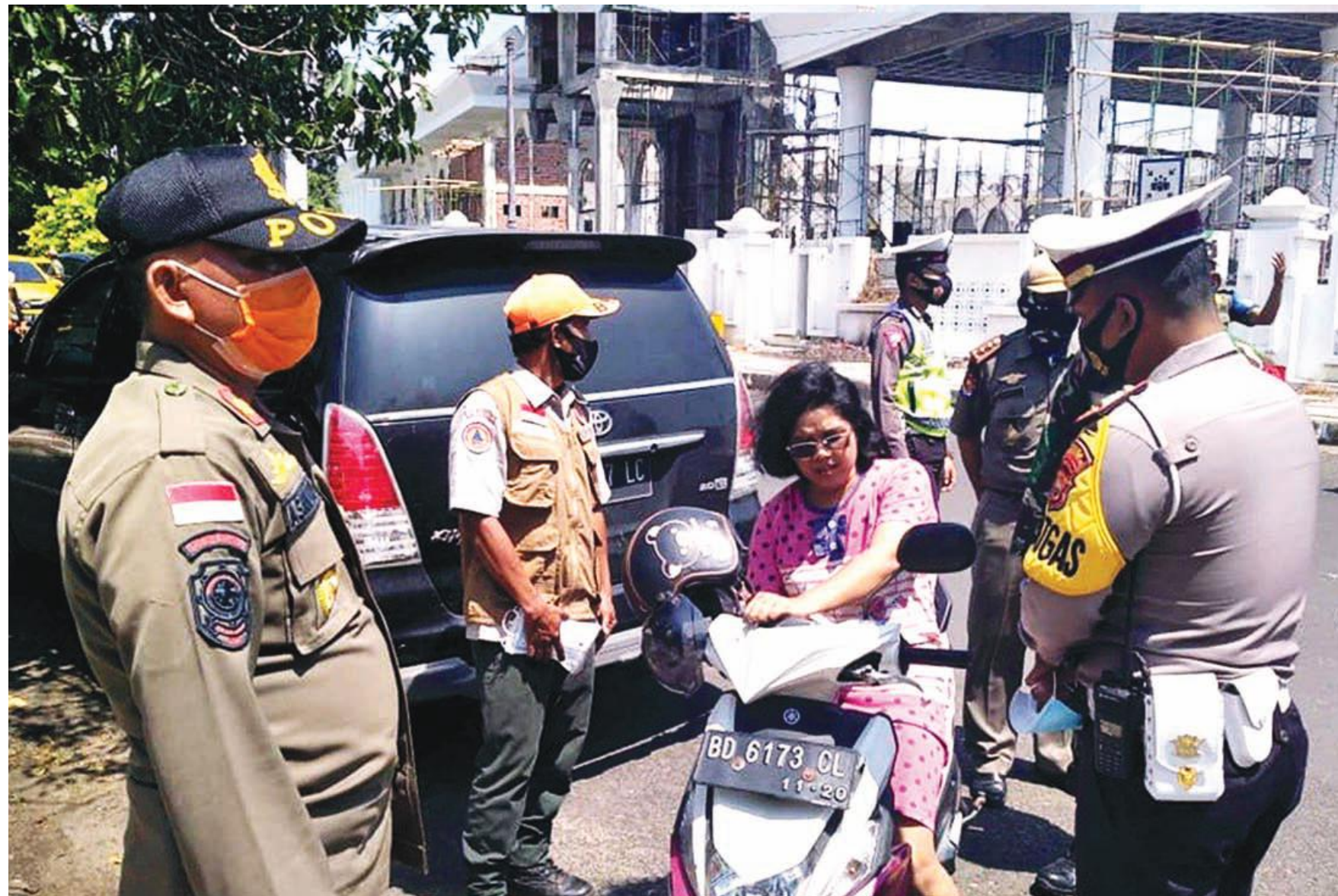
PROKES: Petugas memberikan masker kepada warga yang tidak memakai masker.

Rakyat Bengkulu KAMIS, 19 NOVEMBER | TAHUN 2020 | HALAMAN 20