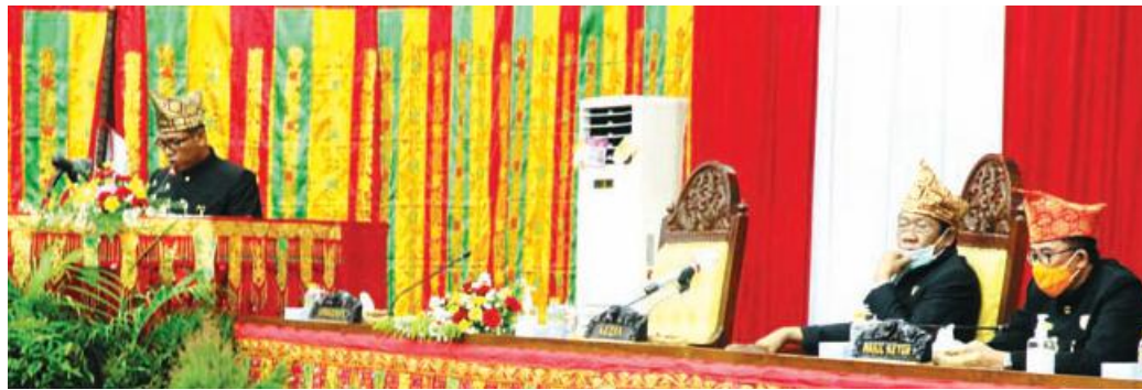
PAPARKAN: Plt Gubernur Bengkulu saat memaparkan sejumlah keberhasilan dan program dalam rapat paripurna istimewa dalam rangka HUT ke-52 Provinsi Bengkulu, Rabu (18/11).

BENGKULU - Plt Gubernur Bengkulu Dedy Ermansyah mengatakan, tantangan Provinsi Bengkulu dalam meningkatkan perekonomian dan membangun Provinsi Bengkulu semakin berat. Untuk itu harus bekerja lebih keras dan membuat strategi yang cemerlang untuk mendorong percepatan pertumbuhan ekonomi di Provinsi Bengkulu.