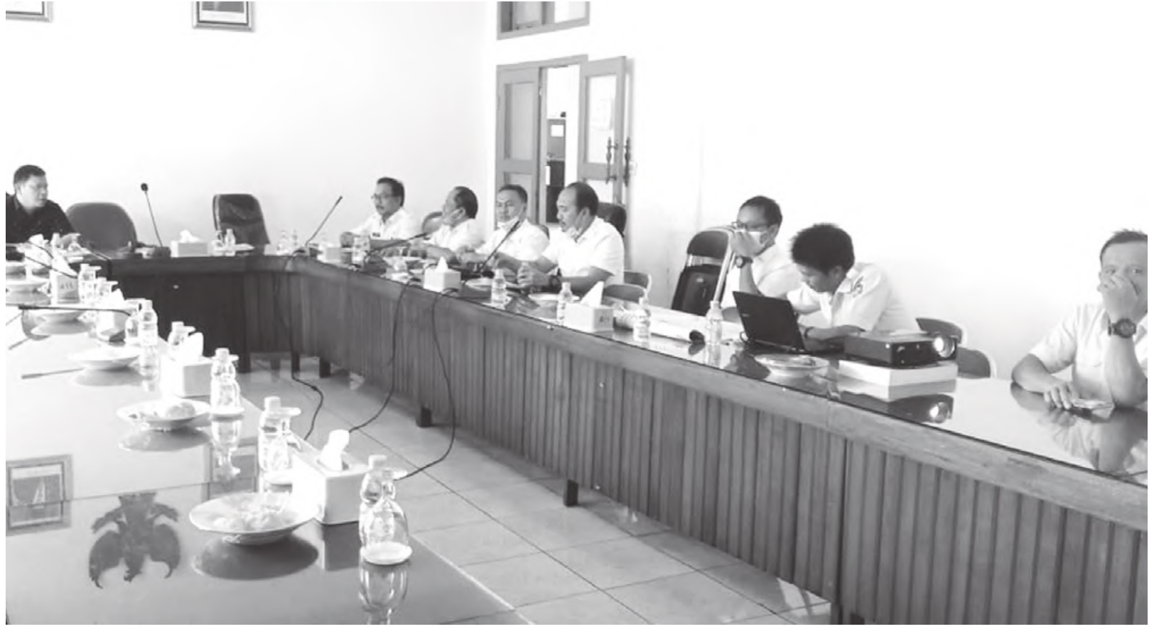
BANMUS: Rapat Banmus tampak sepi karena tidak hadirnya anggota Banmus DPRD Seluma sehingga terpaksa dibatalkan, kemarin.

Dimana sebelumnya, lantaran menerima informasi adanya postingan berbau sara, Badan Pengawas Pemilu (Bawaslu) Kabupaten Seluma akhirnya menegur admin grup media sosial facebook "Menuju Pilbup Seluma 2020" untuk menertibkan anggota grup tersebut. Yang mana dalam grup tersebut, ada postingan simpatisan salah satu pendukung pasangan calon (paslon) tengah menjadi sorotan berbagai pihak. Hal itu setelah postingan tersebut mulai berbau rasis sara yang mendeskripsikan salah satu paslon. (cup)