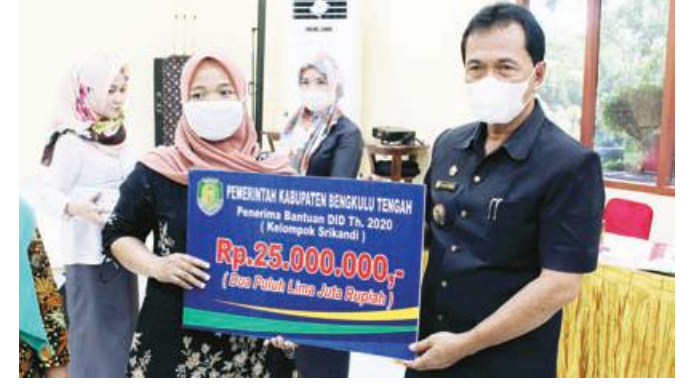
PERHATIKAN RAKYAT : Bupati Benteng Ferry Ramli saat memberikan bantuan usaha modal kepada perwakilan pelaku usaha yang menerimanya.