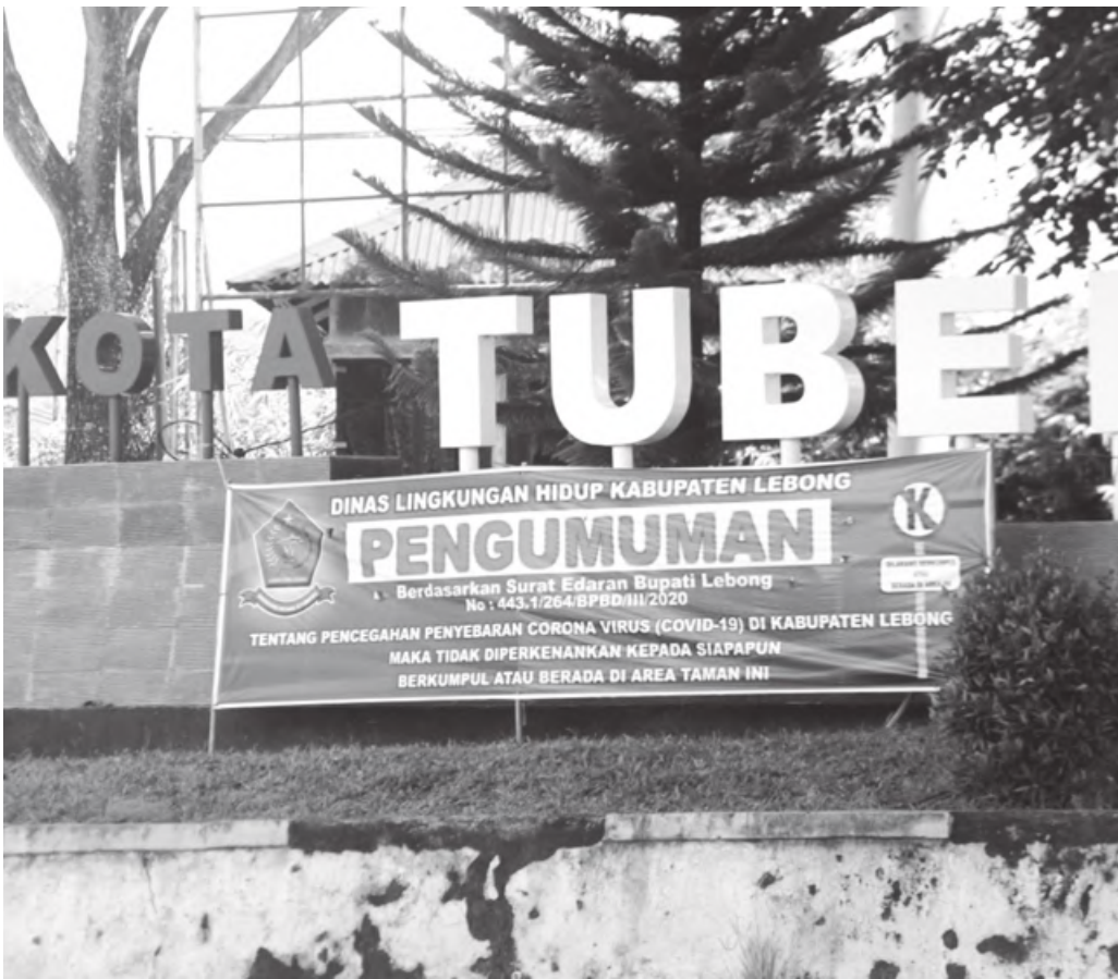
DIPERKETAT: Sejumlah titik area publik kembali dipasang spanduk larangan berkumpul untuk menghindari kerumunan yang bisa menimbulkan klaster baru Covid-19.