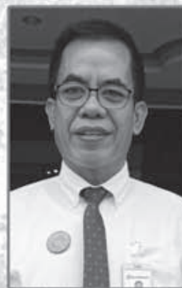
Mulkan Pimpinan Bank Bengkulu Cabang Manna

Bank Bengkulu Selalu Hadir untuk Masyarakat Tetap Patuhi Protokol Kesehatan dengan Selalu Memakai Masker