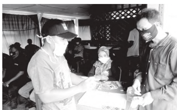
SOSIALISASI: Berbagai kegiatan dilakukan KPU Mukomuko dalam upaya meningkatkan partisipasi pemilih dalam Pilkada Serentak 2020 ini.

"Mulai dari tingkat Desa, Kecamatan, Dinas Pemberdayaan Masyarakat Desa (DPMD) Kabupaten Mukomuko, BKD Mukomuko, dan KPPN Mukomuko," kata Rusli seraya menyebut, KPPN Mukomuko mendapat penghargaan tingkat nasional berupa peringkat kedua atas kinerja penyaluran DAK Fisik dan Dana Desa Tahun 2020. (hue)