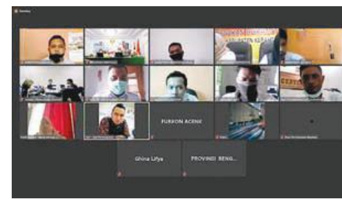
DANA: Rapat Penyesuaian Anggaran Dana Hibah serta Penelitian dan Reviu Anggaran Dana Hibah Pemilihan Tahun 2020.