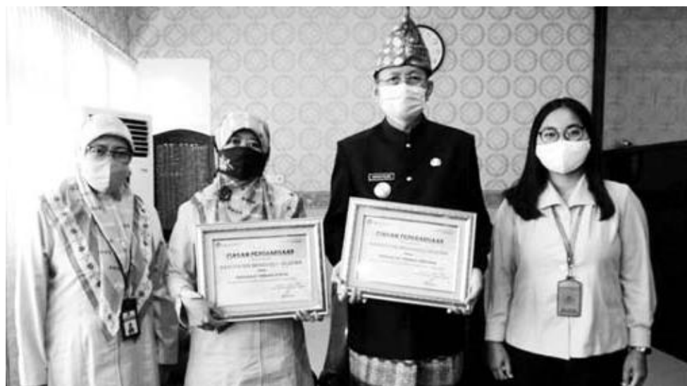
TERIMA: Pemkab Bengkulu Selatan menerima penghargaan pengelolaan keuangan daerah dan pengelolaan dana desa terbaik di Provinsi Bengkulu.