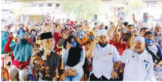
NOMOR 1: Program-program Helmi Hasan selama menjabat sebagai Walikota Bengkulu terbukti sukses dan membahagiakan masyarakat.