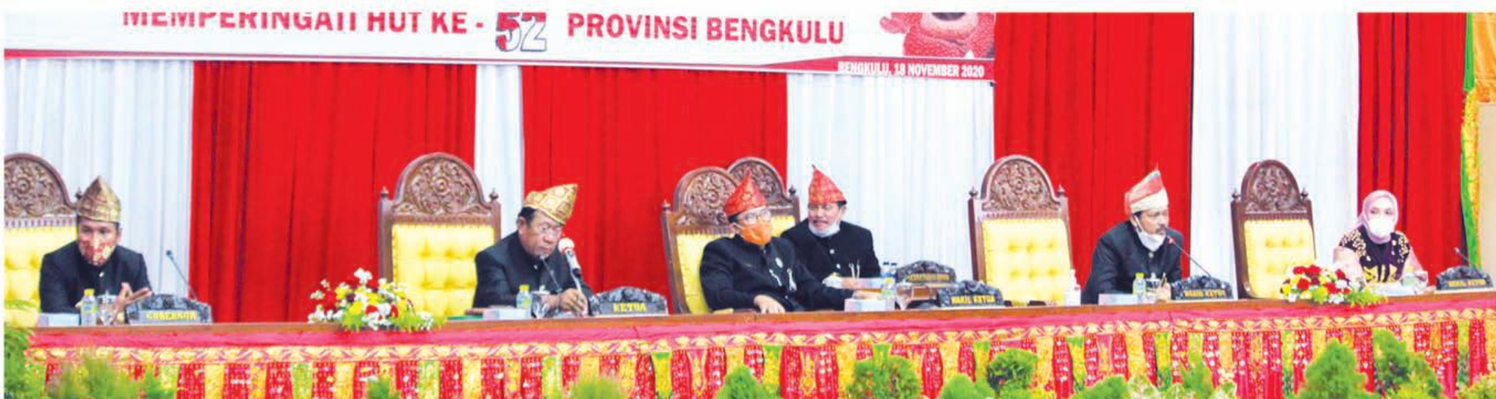
SEMANGAT: Pimpinan DPRD Provinsi Bengkulu tampak semangat saat menggelar Rapat Paripurna Istimewa dalam rangka memperingati HUT Provinsi Bengkulu yang ke 52.

Diketahui, dari 15 ASN ini meliputi 2 ASN Pemerintah Provinsi Bengkulu, 1 ASN Pemkab Rejang Lebong, 3 ASN Pemkab Lebong, 4 ASN Pemkab Kaur, dan 5 ASN Pemkab Kepahiang. (war/jpg)