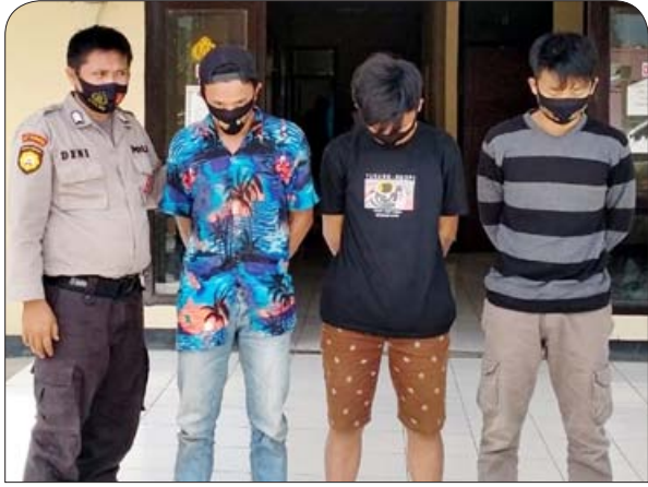
DIAMANKAN: Tersangka pengeroyokan ini sudah mendekam di sel Mapolsek Lebong Tengah.