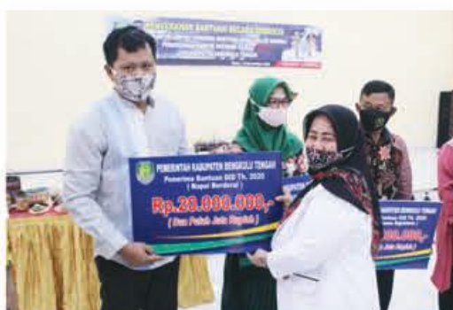
PENYERAHAN: Camat Talang Empat saat menyerahkan bantuan secara simbolis kepada penerima.