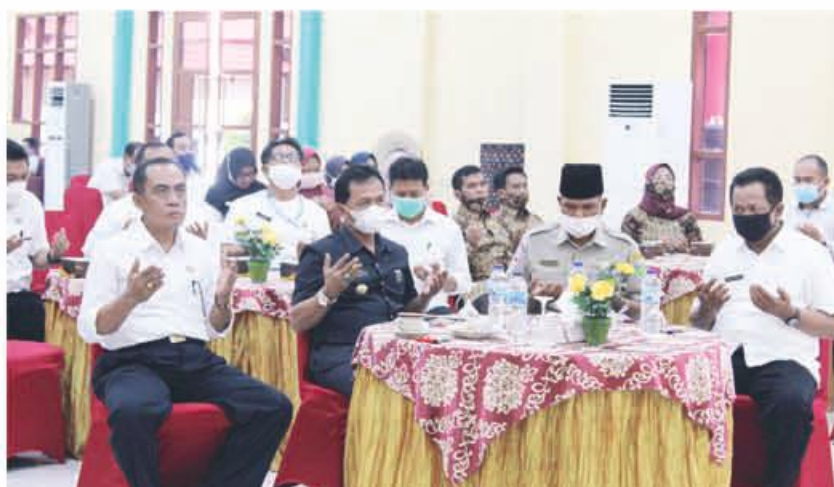
BERDOA: Bupati Benteng didampingi beberapa Kepala OPD saat berdoa demi kelancaran acara.