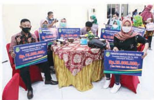
BAHAGIA: Para penerima bantuan modal usaha merasa bahagia saat menerima bantuan modal usaha dari Pemkab Benteng.