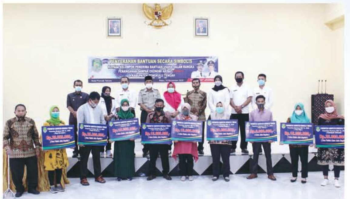
BERSAMA: Kepala OPD, Camat dan Panitia berfoto bersama penerima bantuan modal usaha.