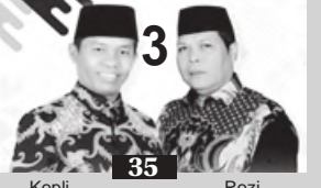
Koplil 35 Rozi