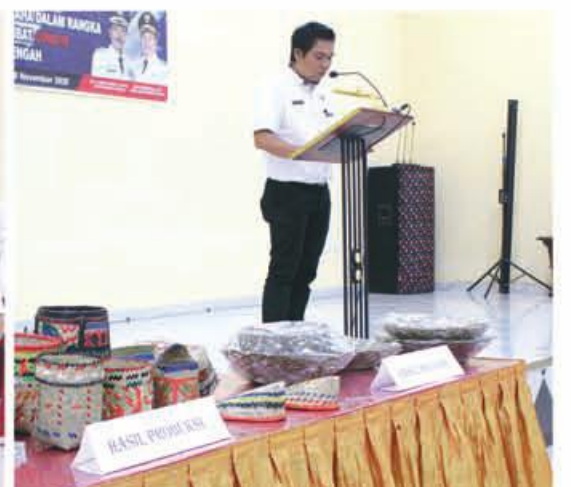
HASIL PRODUKSI: Inilah beberapa hasil produksi dari pelaku usaha yang mendapatkan bantuan modal usaha.