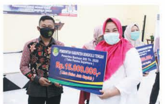
PENYERAHAN: Kepala Dinkes saat menyerahkan bantuan secara simbolis kepada penerima.