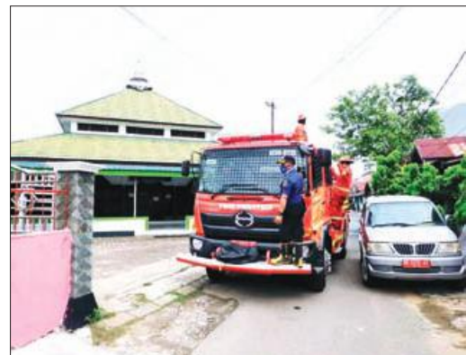
DISINFECTAN: Mobil pemadam kebakaran saat menyemprotkan cairan disinfektan di lingkungan warga Kota Bengkulu.

Menurutnya, penyemprotan lanjutan akan dilakukan sesuai permintaan dari Satgas Covid-19 Kota Bengkulu maupun permintaan masyarakat atau pihak kelurahan. Dinas Damkar akan menyiapkan dua unit mobil pemadam kebakaran dengan kapasitas 5 ribu liter disinfektan. (hkm)