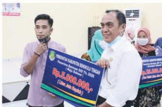
PENYERAHAN: Kepala Bappeda saat menyerahkan bantuan secara simbolis kepada penerima.