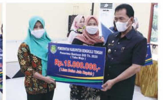
PENYERAHAN: Bupati Benteng saat menyerahkan bantuan secara simbolis kepada penerima.