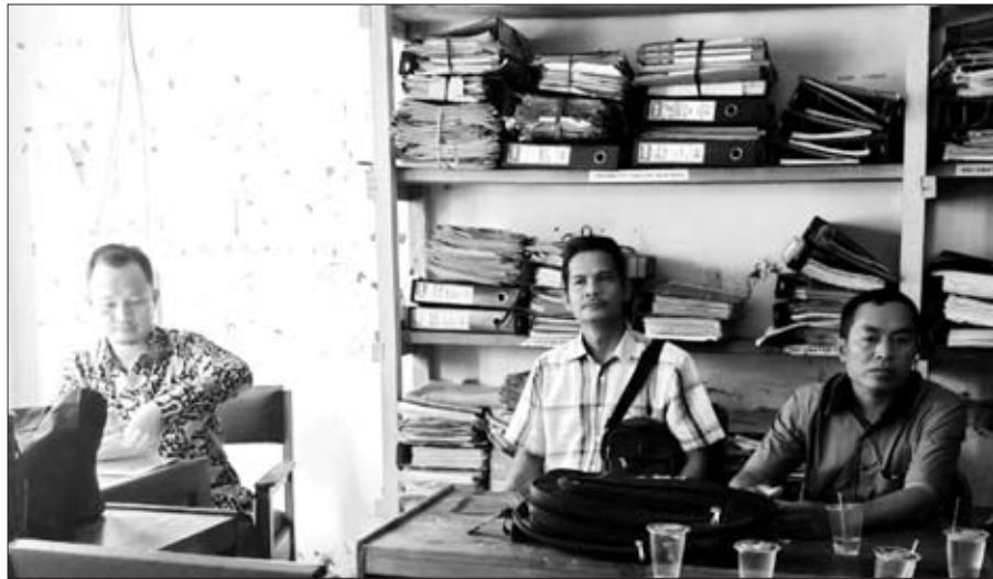
AJUKAN : Salah satu desa saat mengajukan pencairan anggaran dana desa ke PMD Kaur.