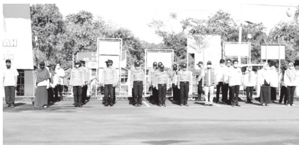
SIAGA: Pemkab Benteng menggelar apel siaga antisipasi bencana di halaman kantor Bupati Benteng.