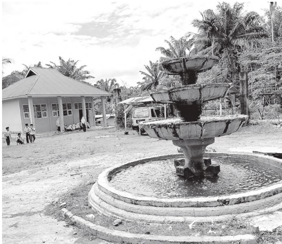
TAMAN BERMAIN: Sisi lain dari lingkungan Ponpes Raudhatunnajah, tampak air mancur yang menghiasi halaman yang juga tempat anak-anak bermain.

Dari data yang didapat RB dalam menyelesaikan program KB, tahun 2020 pemerintah pusat mengucurkan DAK Fisik sebesar Rp 1,13 miliar. Sedangkan DAK Nonfisik berupa bantuan operasional KB Rp 3,9 miliar. Lalu di tahun 2021 mendatang, DAK Fisik sekitar Rp 1,19 miliar. Sedangkan untuk bantuan operasional KB Rp 3,07 miliar. (hue)