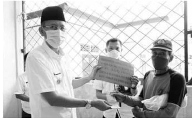
BANTUAN: Penyaluran BLT Covid oleh Pemkab BS beberapa waktu lalu.