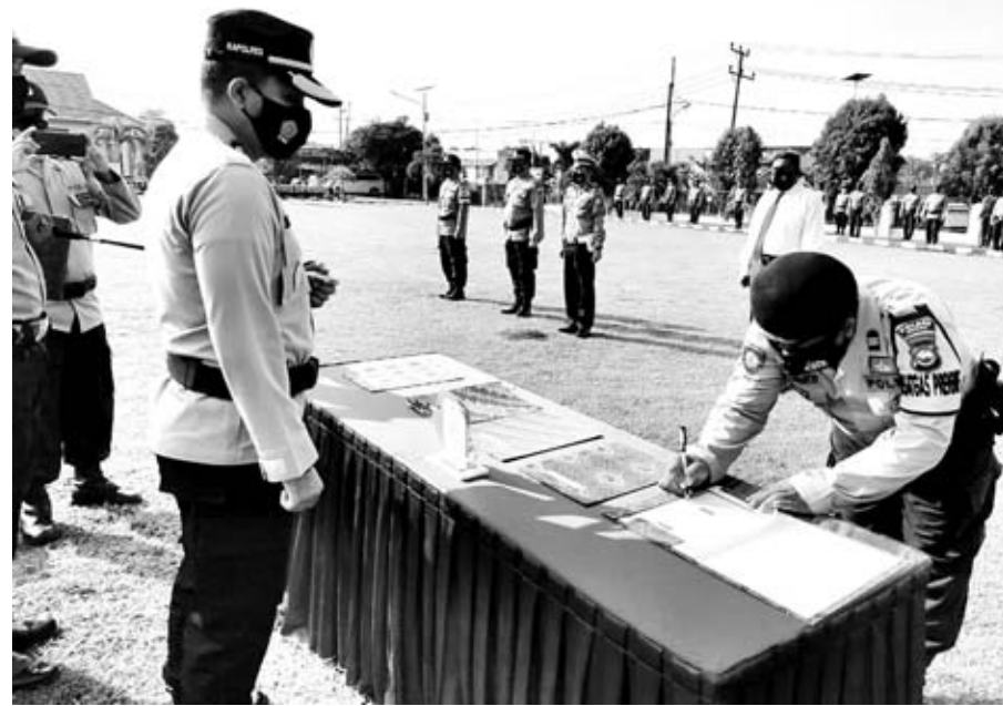
TANDATANGANI: Kapolres Seluma saat memimpin apel penandatanganan pakta integritas netralitas Polres Seluma, kemarin.

"Dengan adanya kegiatan ini masyarakat mengerti apa itu kekerasan dalam rumah tangga, bagaimana cara penanggulangannya, bagaimana cara-cara pencegahannya,"pungkasnya. (cup)