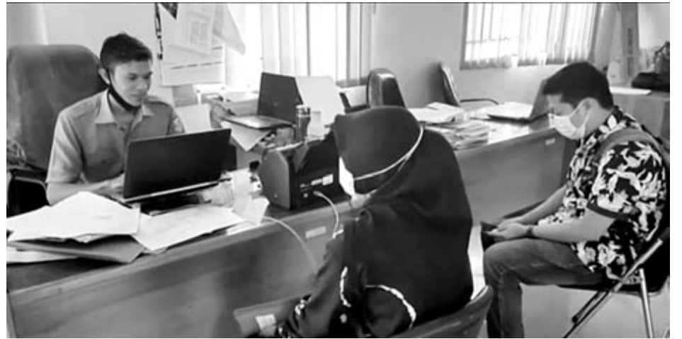
PENBERKASAN: Tampak beberapa peserta yang dinyatakan lolos seleksi CPNS saat melakukan pemberkasan, kemarin.

Nurlin menambahkan, penetapan NIP ini akan mulai dilakukan oleh BKN mulai 1 hingga 30 November, sedangkan Terhitung Mulai Tanggal (TMT) CPNS 2019 direncanakan akan ditetapkan per 1 Desember nanti. BKN akan melaksanakan proses penetapan NIP CPNS