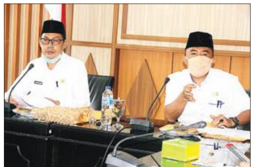
RAPAT FINALISASI: Rapat finalisasi HUT Provinsi Bengkulu ke-52. Penerapan protokol kesehatan ditekan dalam pelaksanaan rangkaian kegiatan HUT Provinsi Bengkulu tahun ini.

"Kalau untuk semua hasil rapid test memang semuanya sudah keluar dan semuanya non reaktif. Namun untuk hasil swab terhadap 36 anggota sekretariat KPU Benteng belum keluar dan akan menunggu beberapa hari kedepan, sebab untuk swab akan dikirim ke Labkesda Provinsi Bengkulu untuk mengetahui hasilnya lebih lanjut," ungkapnya. (jee)