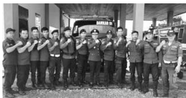
BUTUHAN: Satuan Polisi Pamong Praja dan PBK BS membutuhkan tambahan armada mobil kebakaran.

Oleh sebab itu minimnya armada saat ini dikeluhkan pihak Satpol PP-PBK. Karena jelas Erwin Standar Pelayanan Minimal (SPM) PBK jarak pos Damkar ke setiap kecamatan minimal 15 menit. Sedangkan saat ini beber Erwin untuk menjangkau beberapa wilayah di BS dari pos Damkar ada