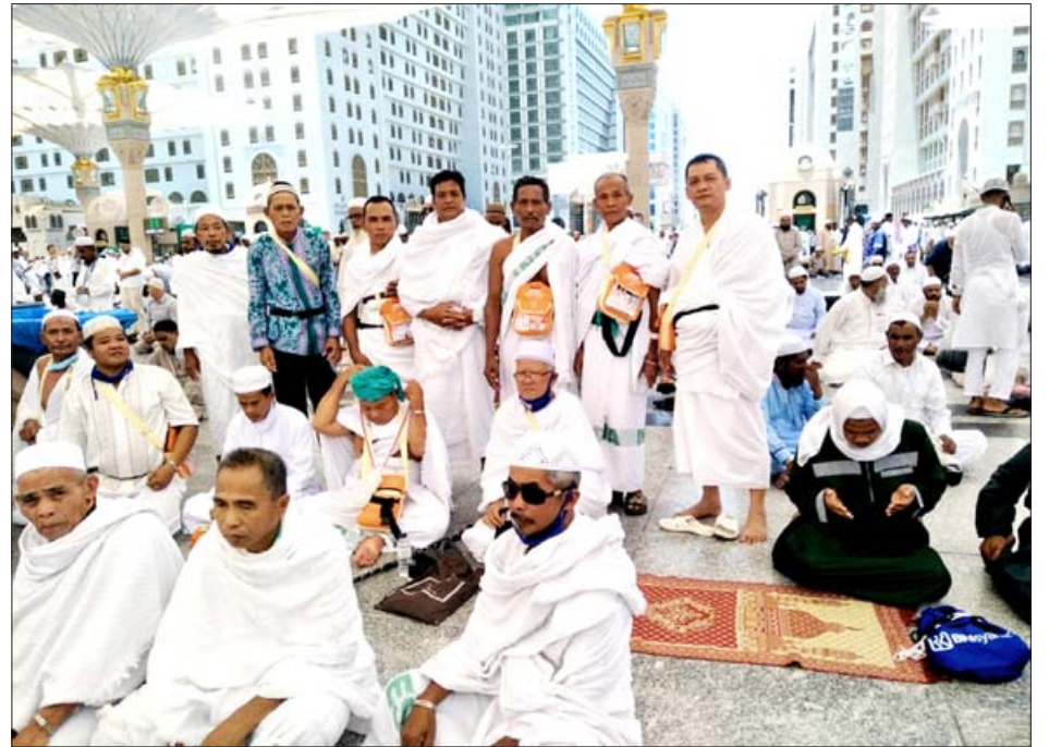
IBADAH HAJI: Waiting List Pendaftaran haji di Kota Bengkulu sampai 27 tahun. Tampak para jamaah haji asal Bengkulu saat melaksanakan ibadah haji tahun lalu.