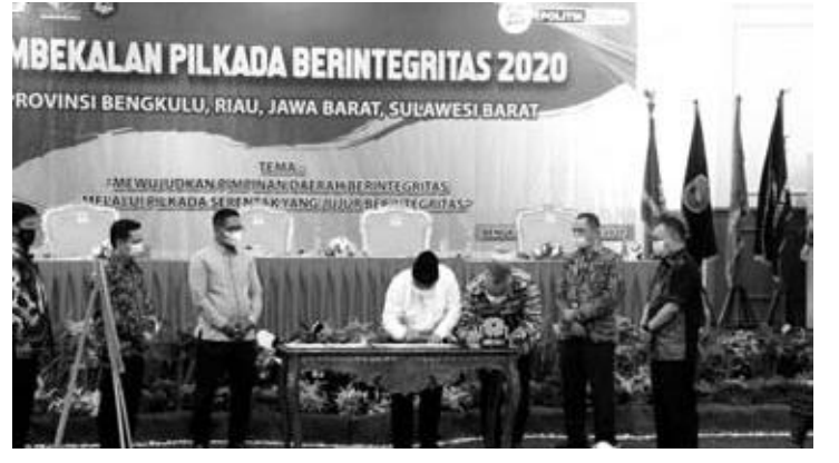
PEMBEKALAN: Tiga Paslon mengikuti pembekalan bagi pasangan calon kepala daerah dan penyelenggara Pemilu, sekaligus tanda tangan pakta integritas, kemarin.

Untuk itu, pihaknya selaku pengawas sangat berharap atas adanya dukungan semua pihak.