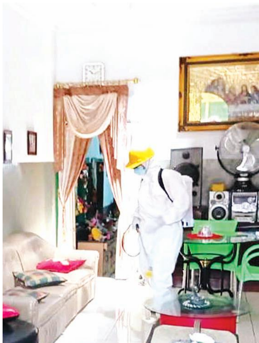
PENCEGAHAN: Petugas Tim Satgas Covid-19 saat melakukan penyemprotan cairan disinfektan di rumah salah satu warga.