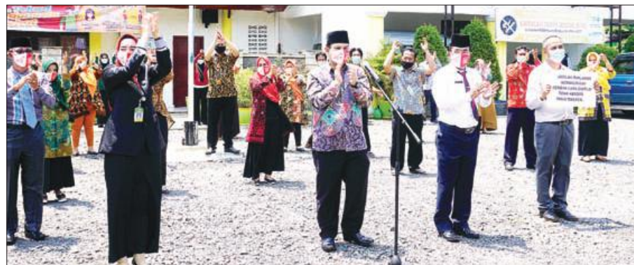
TEPUK TANGAN: Jajaran Dinkes Provinsi Bengkulu melakukan gerakan tepuk tangan selama 56 detik peringati HKN ke-56.

"Masyarakat Bengkulu untuk menjadi pahlawan bukan hanya di Hari Kesehatan saja, Melainkan menjadi pahlawan setiap saat dengan menerapkan protokol Covid-19," ungkapnya. (hkm)