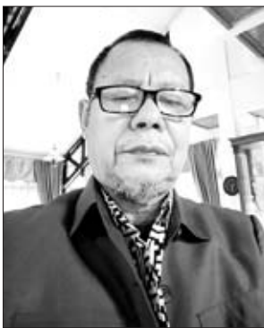
OLEH: Syaiful Anwar. AB

Pengertian Visi adalah serangkaian kata yang menunjukkan impian, cita-cita atau nilai inti sebuah organisasi, perusahaan atau instansi. Visi merupakan tujuan masa depan sebuah instansi, organisasi, atau perusahaan. Visi juga adalah pikiran-pikiran yang ada di dalam benak para pendiri. Pikiran-pikiran tersebut adalah gambaran tentang masa depan yang ingin dicapai. Jika dirangkum, definisi atau pengertian visi adalah sebagai berikut: Visi adalah suatu tulisan yang menyatakan Cita-cita suatu seseorang, organisasi, perusahaan, instansi, di masa depan. Visi adalah suatu