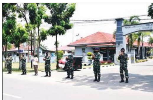
TEPUK TANGAN: Lanal Bengkulu melakukan kegiatan tepuk tangan 56 detik dalam rangka HKN.