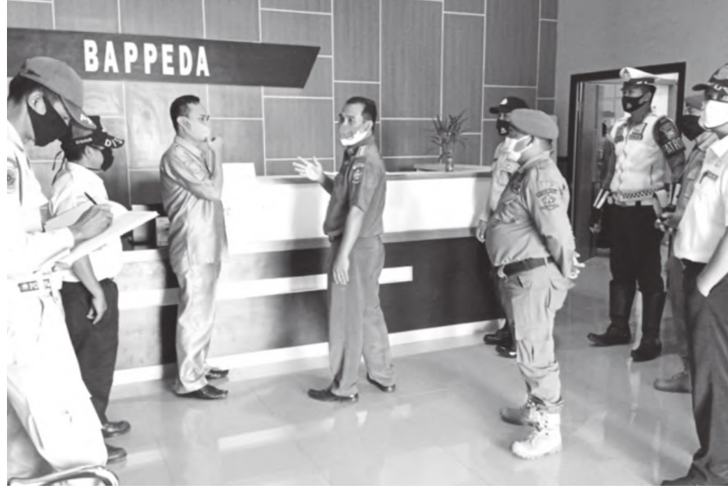
KETAT: Tidak hanya ke masyarakat, Tim Yustisi Protokol Kesehatan Covid-19 juga rutin memantau kedisiplinan PNS memakai masker.