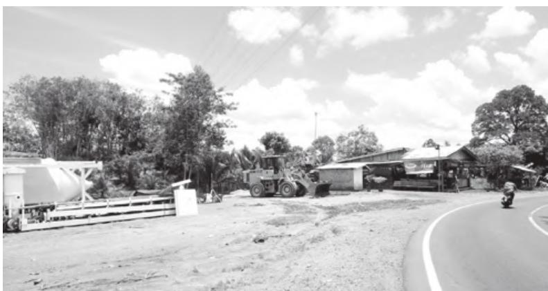
SUKARAMI: Terlihat beberapa alat untuk memulai pengerjaan tol di wilayah Desa Sukarami sudah diletakkan kawasan tersebut.

"Apabila nilai ganti ruginya sudah dikeluarkan oleh KJPP, maka musyawarah akan dilaksanakan pada tanggal tersebut. Namun apabila nilai ganti rugi belum dikeluarkan oleh KJPP, maka musyawarah dengan WTP tidak bisa digelar dan akan ditunda hingga KJPP mengeluarkan penetapan nilai ganti rugi yang sudah mereka hitung berdasarkan penilaian mereka di lapangan," ungkapnya.