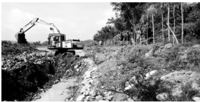
KERUK: Nampak pengerukan irigasi menuju ke persawahan warga di Luas oleh CV LG Pratama.

KOTA BINTUHAN - Lagi CV LG Pratama yang bergerak di bidang galian C di wilayah Kecamatan Luas Kabupaten Kaur menyalurkan bantuan CSR untuk warga. Sesuai dengan permintaan warga, CV LG Pratama mengeruk irigasi untuk melancarkan air ke hamparan sawah di Lubuk Ling yang terletak di Pulau Tengah Kecamatan Luas Kabupaten Kaur.