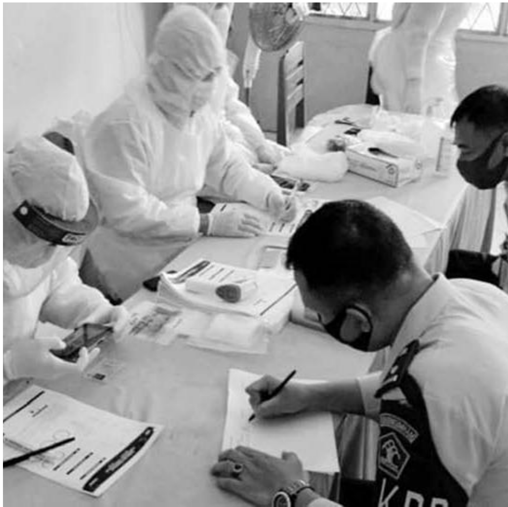
SWAB: Puluhan petugas Rutan Kelas II B Manna di Swab oleh petugas medis.