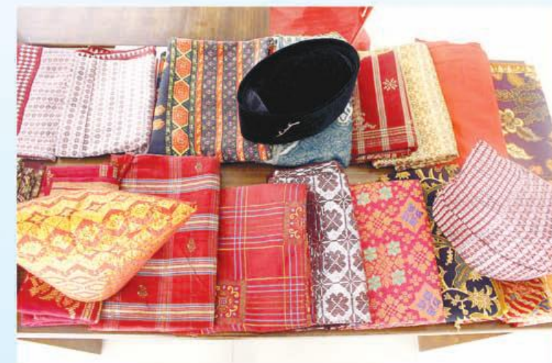
SONGKET: Kain songket khas Bengkulu dibanderol dari harga ratusan ribu hingga jutaan rupiah.