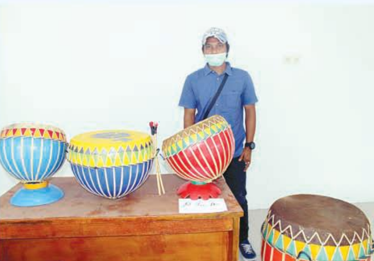
DOL: Alat musik dol menjadi alat musik khas Bengkulu yang terbuat dari batang pohon kelapa.