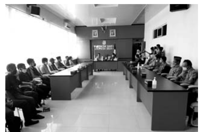
SALURKAN: Penyaluran CSR dari BB ke penerima secara simbolis dilakukan di Ruang Rapat Bupati, kemarin.

"Semoga dana CSR ini bisa bermanfaat baik, apalagi ini untuk pembangunan tempat ibadah," pungkaskan Bundra. (cup)