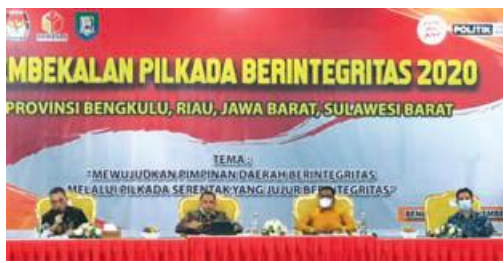
INTEGRITAS: Pembekalan pilkada berintegritas 2020.