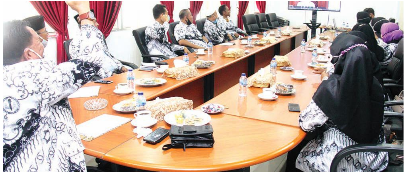
SIMPOSIUM: Pengurus PGRI Provinsi Bengkulu melaksanakan virtual meeting dengan Ketua PB PGRI.

Selain bergaji di bawah Rp 5 juta, guru honorer yang mendapatkan insentif gaji tersebut juga harus terdaftar di BPJS Ketenagakerjaan. (qia)