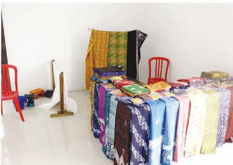
BATIK: Kain batik besurek yang menjadi batik khas Provinsi Bengkulu