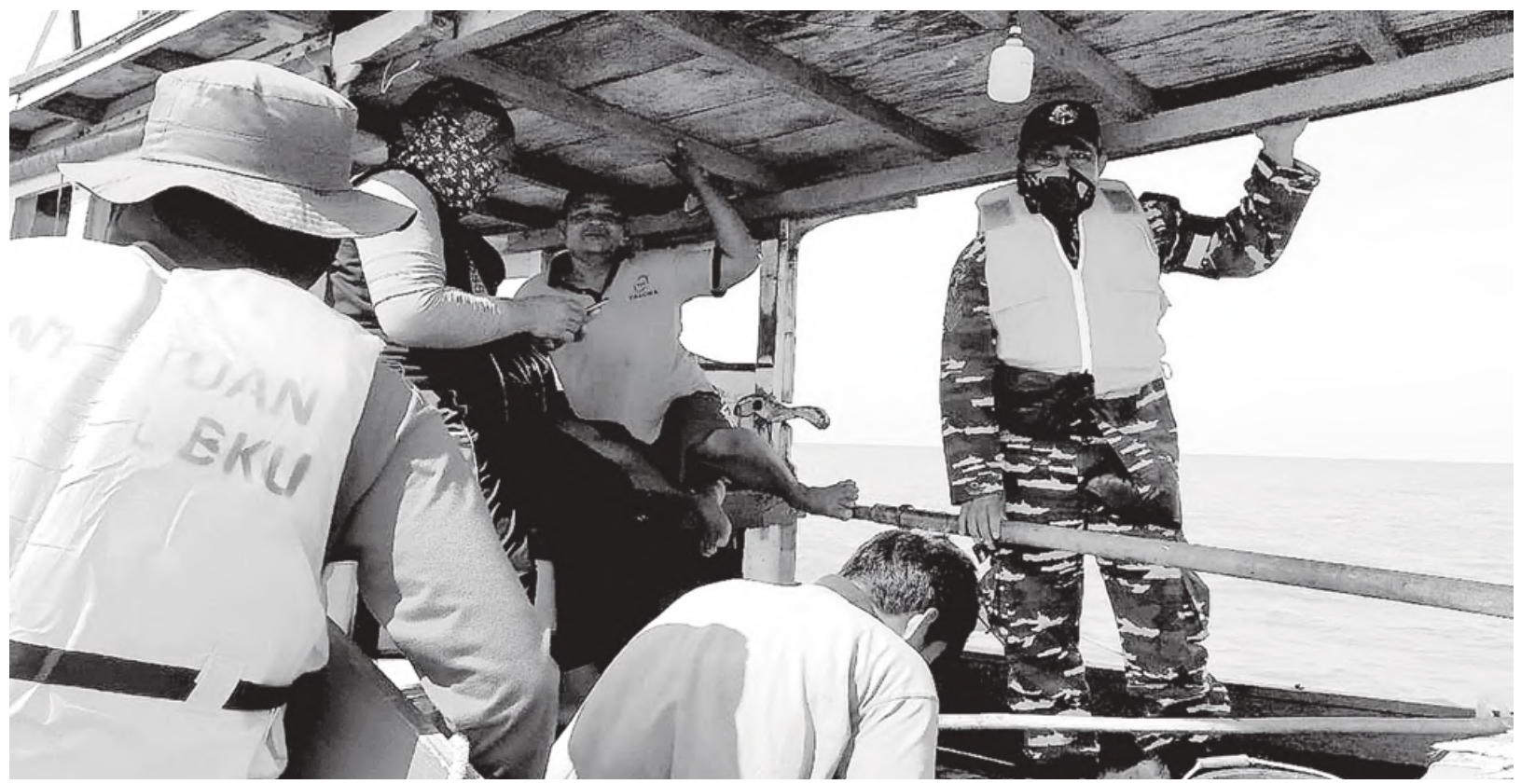
DATA: Tim Illegal Fishing mendarat di kapal yang tengah menangkap ikan di perairan Mukomuko.

Syarat-syarat siswa bisa diajukan dapat dana BSM, diantaranya ada surat keterangan miskin dari pemerintah desa setempat dan kecamatan, foto kopi KTP orangtua, foto kopi kartu keluarga, dan dokumen kondisi rumah. "Mudah-mudahan saja seluruh siswa yang kami ajukan sebanyak lebih 1.000 orang dapat diakomodir seluruhnya," harap Ruslan. (hue)