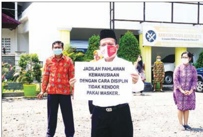
KAMPANYE: Poster Kampanye ajakan agar disiplin pakai masker dan jangan sampe kendor.

Herwan juga mengajak kembali masyarakat agar terus mengobarkan jiwa kepahlawanan di tengah pandemi Covid-19. Yakni dengan mencegah penularan Covid dan terus mematuhi protokol kesehatan 3M (memakai masker, menjaga jarak, dan