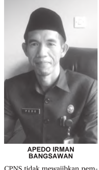
APEDO IRMAN BANGSAWAN

PELABAI - Jika tidak ada kendala, 98 Calon Pegawai Negeri Sipil (CPNS) Kabupaten Lebong yang lulus seleksi formasi 2019, akan mulai bertugas 1 Desember mendatang. Namun hingga kemarin (12/11) baru 88 CPNS yang melengkapi pemberkasan di Badan Kepegawaian dan Pengembangan Sumber Daya Manusia (BKPSDM) Kabupaten Lebong.