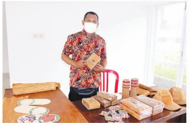
KLANTUNG: Kerajinan tangan dari kulit kayu yang dapat di ubah menjadi tas, dompet, topi dan lainnya.

UPTD Taman Budaya Provinsi Bengkulu menggelar pameran seni kerajinan tangan yang dilaksanakan di salah satu gedung Taman Budaya Provinsi Bengkulu. Kegiatan ini dibuka oleh Nirwan Sukandri yang dalam hal ini diwakili oleh Sardi selaku ketua panitia kegiatan. Pameran seni kerajinan tangan yang digelar pada tanggal 4 November 2020 ini, menampilkan beberapa produk kerajinan tangan khas Bengkulu. Yaitu kain batik besurek yang dibanderol dari harga ratusan ribu hingga jutaan rupiah, alat musik dol berkisar antara Rp 500 ribu hingga jutaan rupiah tergantung dari ukuran yang dipesan. Ada juga klantung yang dapat diubah menjadi tas, topi, dompet dan lainnya. Ada kain songket khas Bengkulu, kerajinan tangan dari rotan serta kerajinan tangan dari tanah liat. (Andre)