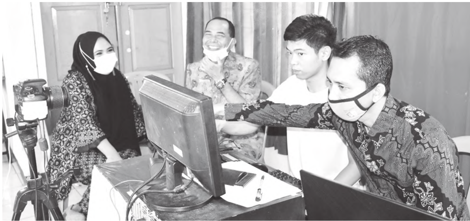
LAPAS: KPU dan Dukcapil mendatangi Lapas IIB Arga Makmur untuk melakukan pendataan warga Benteng yang berada di lapas tersebut.

Lanjutnya, anggaran DAK yang diterima pada tahun 2020 ini sebesar Rp 8 miliar yang peruntukkan selain untuk pembangunan fisik gedung, perbaikan ruang belajar. Anggaran DAK ini diperuntukkan untuk pengadaan barang seperti perangkat komputer sebagai penunjang ujian nasional berbasis komputer atau saat ini sebagai penunjang pembelajaran dalam jaringan," pungkasnya. (jee)