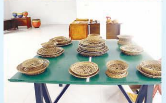
KERAJINAN : Hasil kerajinan tangan dari rotan dan tanah liat yang dapat menjadi berbagai bentuk.